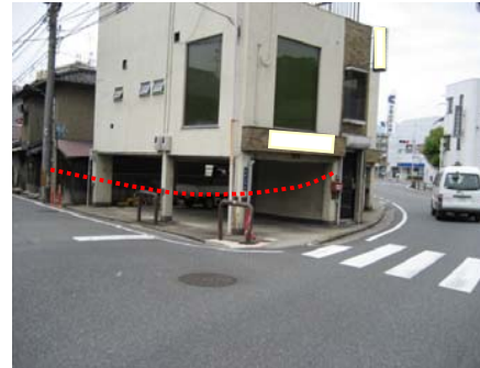
<東側から西側を望む>