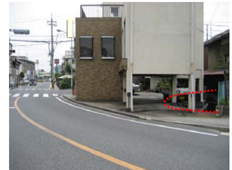
<西側から東側を望む>