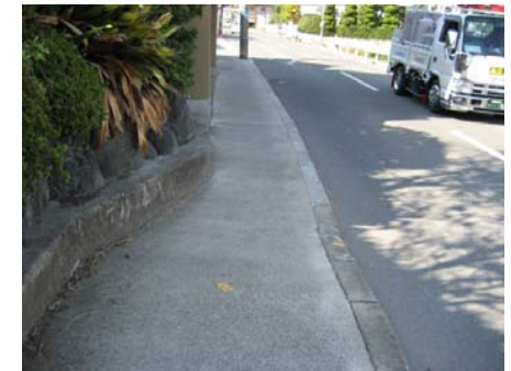
<南側から北側を望む> (過年度施工箇所)