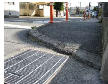
<北側から南側を望む>