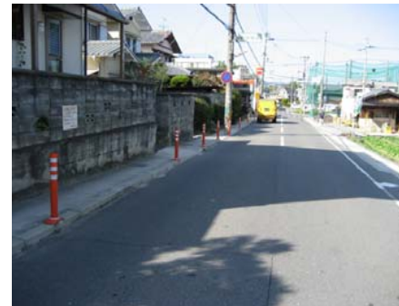
<南側から北側を望む> (過年度施工箇所)