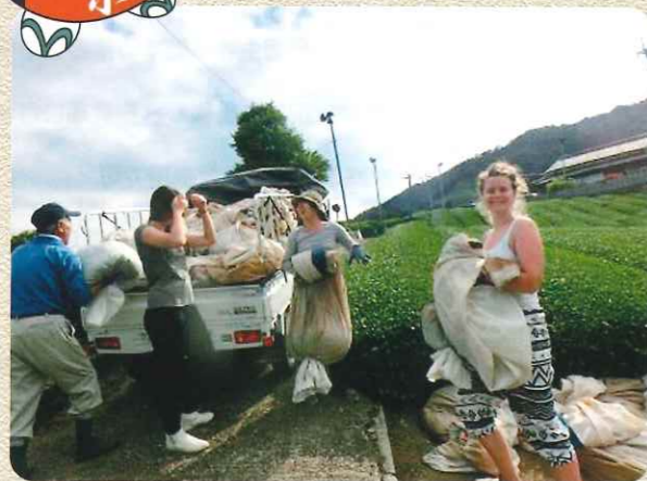
お茶の収穫体験の様子