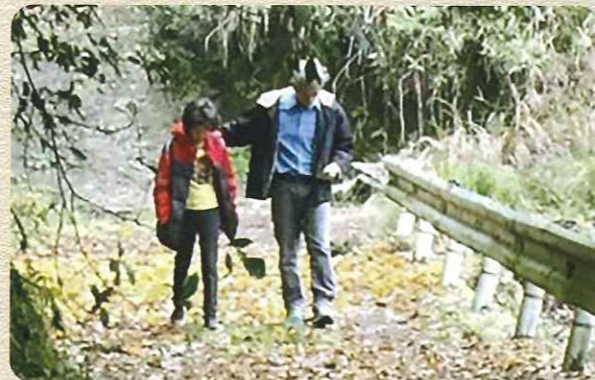
森林散策を楽しむ宿泊者